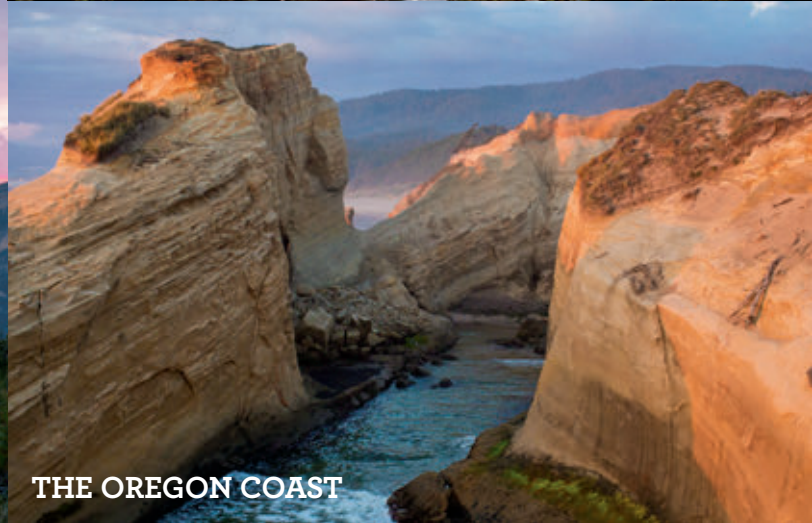
THE OREGON COAST