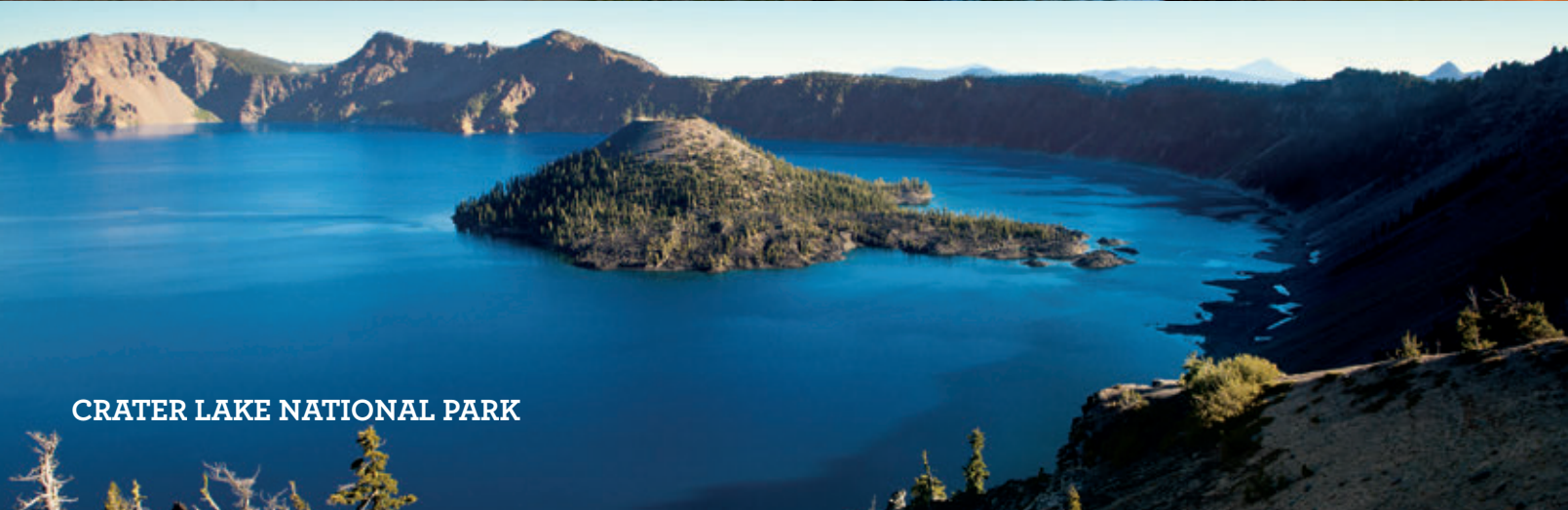
CRATER LAKE NATIONAL PARK