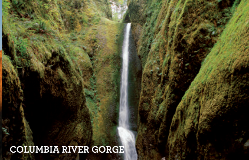
COLUMBIA RIVER GORGE